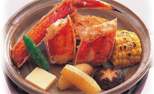
本タラバかにバター焼き 4,000円(税込4,400円)