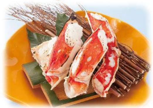
本タラバ焼かに 4,500円(税込4,950円)