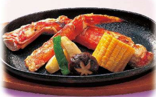
本タラバかにステーキ 5,800円(税込6,380円)