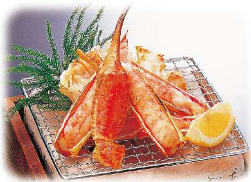
ズワイ焼かに 3,300円(税込3,630円)