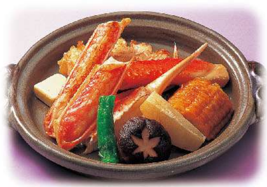
ズワイかにバター焼き 3,500円(税込3,850円)