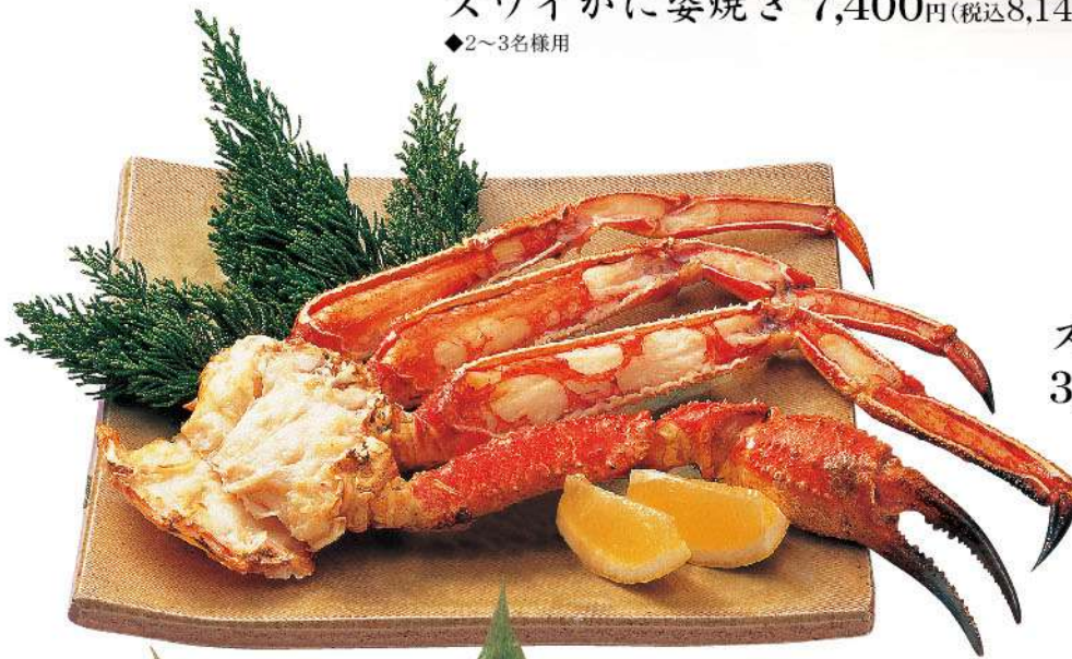
ズワイかに片身焼き 3,700円(税込4,070円)