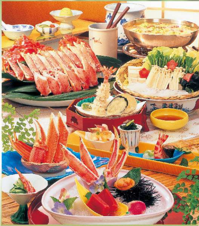
※写真は「花橘」です。かにすき、雑炊は三人前のイメージです。