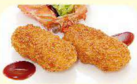
かにクリームコロッケ 750円 (税込825円)