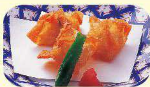
かに揚げシューマイ 900円 (税込990円)