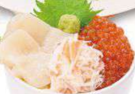
ホタテ・いくら・かに丼 1,500円(税込1,650円) ◆ホタテ・いくら・かに丼◆汁物