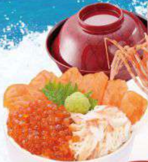
サーモン・いくら・かに丼 1,700円(税込1,870円) ◆サーモン・いくら・かに丼◆汁物