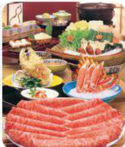
特選飛騨牛しゃぶしゃぶコース 至福 しふく

●お通し ●ズワイかに造り ●本タラバかに親爪 天ぷら ●特選飛騨牛しゃぶしゃぶ(肉・野菜盛り ・餅・きしめん) ●ご飯 ●香の物 ●デザート