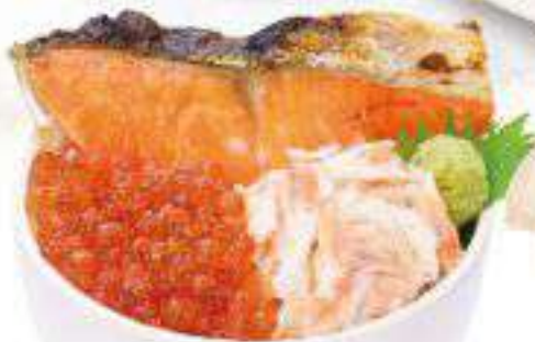
鮭・いくら・かに丼 1,700円(税込1,870円) ◆鮭・いくら・かに丼◆汁物