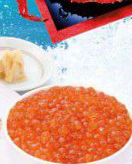
いくら丼 1,700円(税込1,870円) ◆いくら丼◆汁物