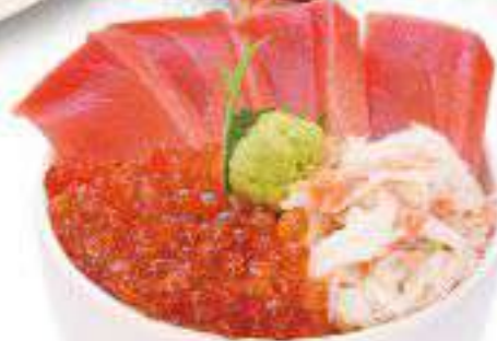
まぐろ・いくら・かに丼 1,800円(税込1,980円) ◆まぐろ・いくら・かに丼◆汁物