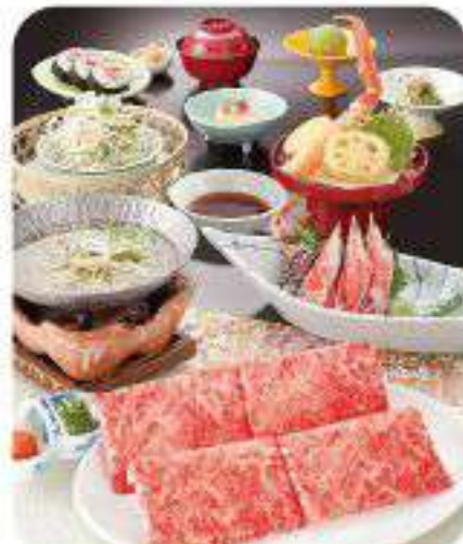
特選飛騨牛しゃぶしゃぶ会席 清福 せいふく

●お通し ●かに豆腐 ●ズワイかに造り ●特選飛騨牛しゃぶしゃぶ小鍋 ●かに天ぷら ●汁物 ●かに入り太巻 ●デザート