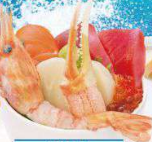
特製海鮮丼 2,000円(税込2,200円) ◆特製海鮮丼(ボタン海老・かに・まぐろ・ホタテ・サーモン・いくら)◆汁物