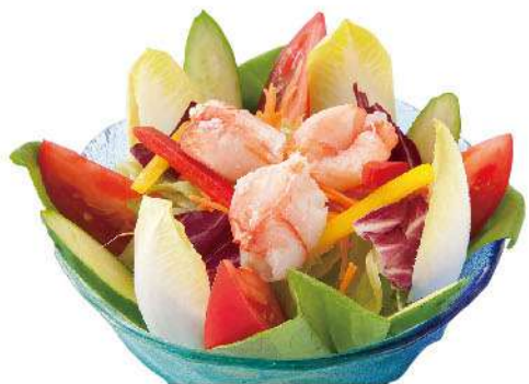
かにサラダ 1,350円(税込1,485円)