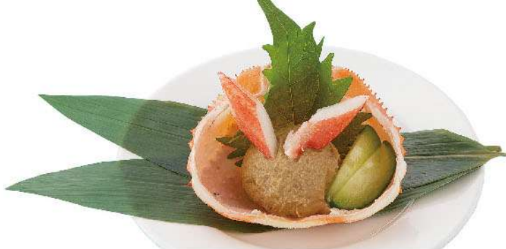
かにみそ 700円(税込770円)