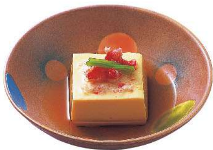
かに豆腐 550円(税込605円)