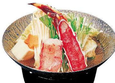
本タラバかに小鍋 2,800円(税込3,080円)