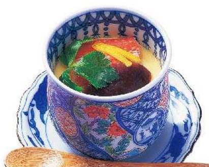
かに茶碗蒸し 750円(税込825円)