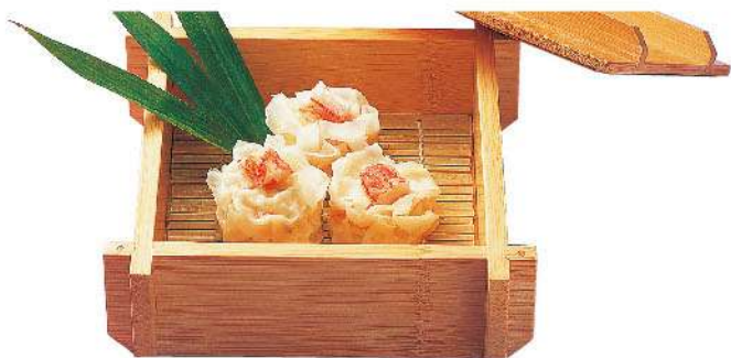
かにシューマイ 1,000円(税込1,100円)