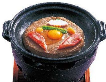
かにみそ焼 1,200円(税込1,320円)