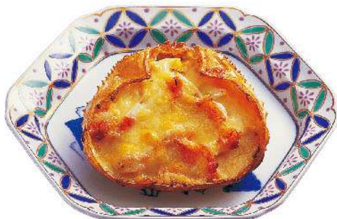
かにグラタン 1,000円(税込1,100円)