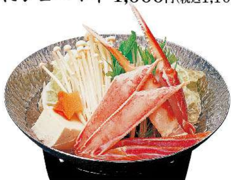
ズワイかに小鍋 2,300円(税込2,530円)