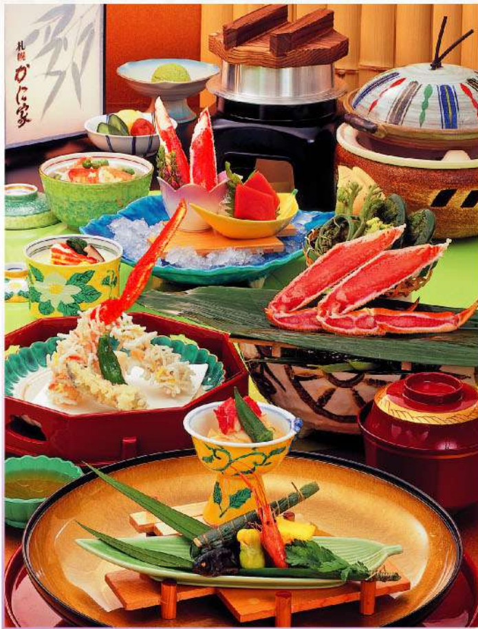
※写真はイメージです。