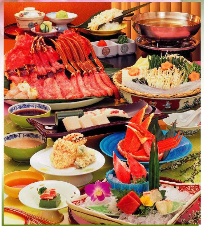
※写真は「水芭蕉」のコースで、かにしゃぶは三人前のイメージです。