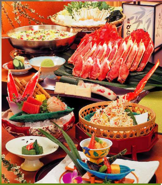
※写真は「石楠花」のコースで、かにすき、雑炊は三人前のイメージです。