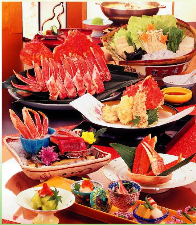
※写真は「紫式部」です。かにすき、雑炊は三人前のイメージです。