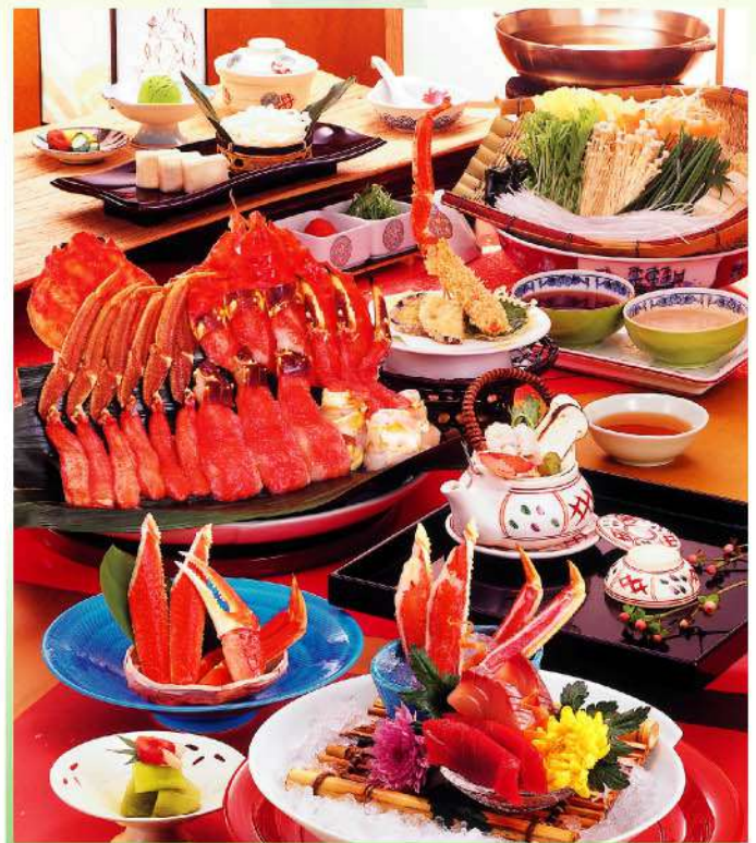
※写真は「富士薊」です。かにしゃぶは三人前のイメージです。